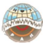
Институт физики Земли РАН